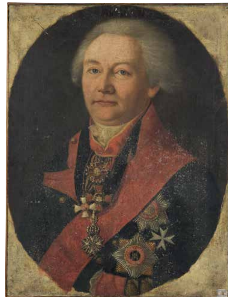
Шеф Кексгольмского мушкетерского полка генерал-лейтенант граф Федор Федорович Буксгевден. Неизвестный художник, 1797–1798 годы

Автор — кандидат исторических наук, руководитель департамента культуры города Москвы