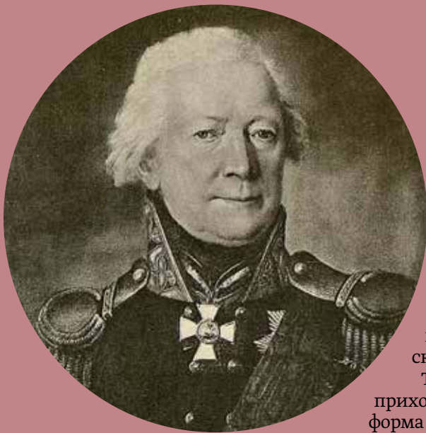
Генерал от инфантерии Богдан Федорович Кнорринг. Неизвестный художник, около 1808 года

отсутствует на эрмитажном портрете. Кроме того, сын Кнорринга Карл, хотя и был записан 1 января 1787 года вахмистром в конную гвардию, уже в январе 1796 года поступил капитаном в армейский полк.