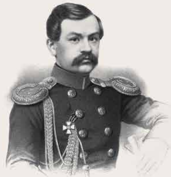
Иван Тяжельников Иван Тяжельников ТАЖЕЛЬНИКОВ.

Окончательную точку позволяет поставить сравнение картины Репина с портретом Ивана Тяжельникова 1857 года, литографированным по рисунку Федора Пашенного. Он помещен в одной из 60 тетрадей грандиозного издания «Портреты лиц, отличившихся заслугами и командовавших действующими частями в войне 1853, 1854, 1855 и 1856 годов», которое насчитывает более 400 изображений. Характерная