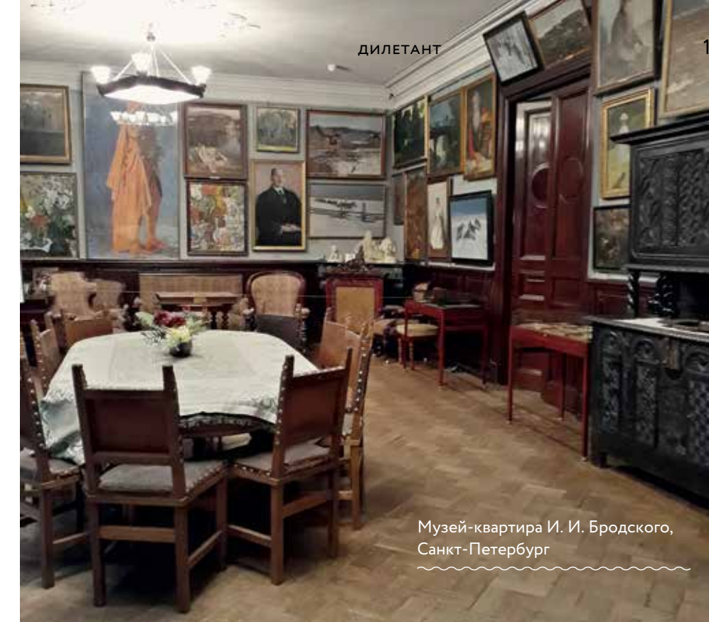
Музей-квартира И. И. Бродского, Санкт-Петербург

На вас сурово глядит уже далеко не молодой, но все еще бравый боевой генерал. Кисть Репина замечательно передает волевой характер николаевского ветерана. Это настоящий герой своего времени. Такой «слуга царю, отец солдатам» не щадил ни врага, ни себя, ни подчиненных. Перед нами не постаревший Печорин или Марлинский, а надежный, как русский штык, армейский Максим Максимыч, которому судьба к концу жизни благоволила получить генеральские эполеты.