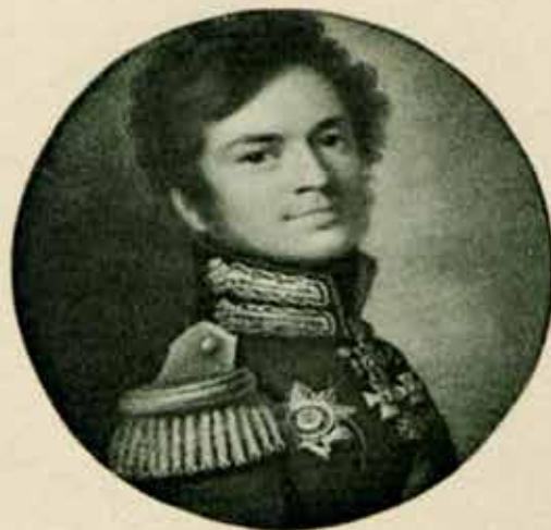
Генералъ-Маіоръ ЯКОВЪ АЛЕКСѢВИЧЪ ПОТЕМКИНЪ. Командиръ Л.-Гв. Семёновскаго полка 1812—1820.

«Русские портреты XVIII и XIX веков». Том III. СПб., 1907