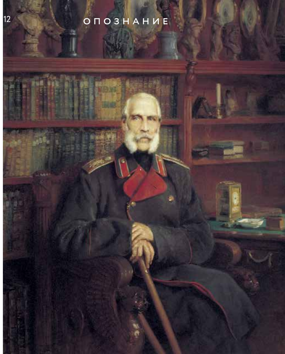
Граф Сергей Григорьевич Строганов. Константин Маковский, 1882 год Государственный Русский музей

нию специалистов Государственного биологического музея имени К. А. Тимирязева, которым я показал портрет, самое вероятное время на картине — сентябрь или даже начало октября. Причём в разрезе пальто, под бородой генерала, виден белый треугольник. Конечно, вдали от службы, в усадьбе ветеран мог поддеть что-то своё, например, укрыть шею светлым кашне. Но, скорее всего, он одет в летний белый китель, который военные носили до середины сентября по старому стилю — фактически до начала октября по современному календарю. В пользу этого также свидетельствует белый манжет, выглядывающий внутри правого рукава пальто. Кроме того, под откинутым на колене краем пальто мы не видим полы тёмно-зелёного сюртука, полагавшегося вместо кителя в остальное время года.