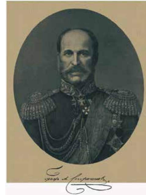
Граф Александр Григорьевич Строганов. Гравюра 1870-х годов Из книги «Министерство внутренних дел. Исторический очерк. 1802–1902». СПб., 1901

Но старший граф Строганов умер в Петербурге ещё 28 марта 1882 года, что никак не вяжется с пейзажем на картине, а также названиями дачи и усадьбы. Большой посмертный портрет Сергея Григорьевича в том же 1882 году выполнил Константин Маковский. Это