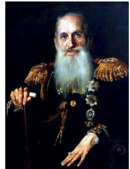
Граф Александр Григорьевич Строганов. Николай Кузнецов, 1891 год Одесский историко-краеведческий музей

дочерей. Не имея наследников, он приказал упаковать весь богатейший семейный архив в семь дубовых ящиков и утопить в море. А вот свою замечательную библиотеку, насчитывавшую 19 тысяч изданий, он завещал Новороссийскому (ныне Одесскому) университету, к созданию которого имел прямое отношение. Ранее он столь же щедро вместе с братом передал ценнейшую фамильную библиотеку Строгановых (более 22 тысяч редких томов) в новый Томский университет. Похоронен граф в Одессе на Старом кладбище.