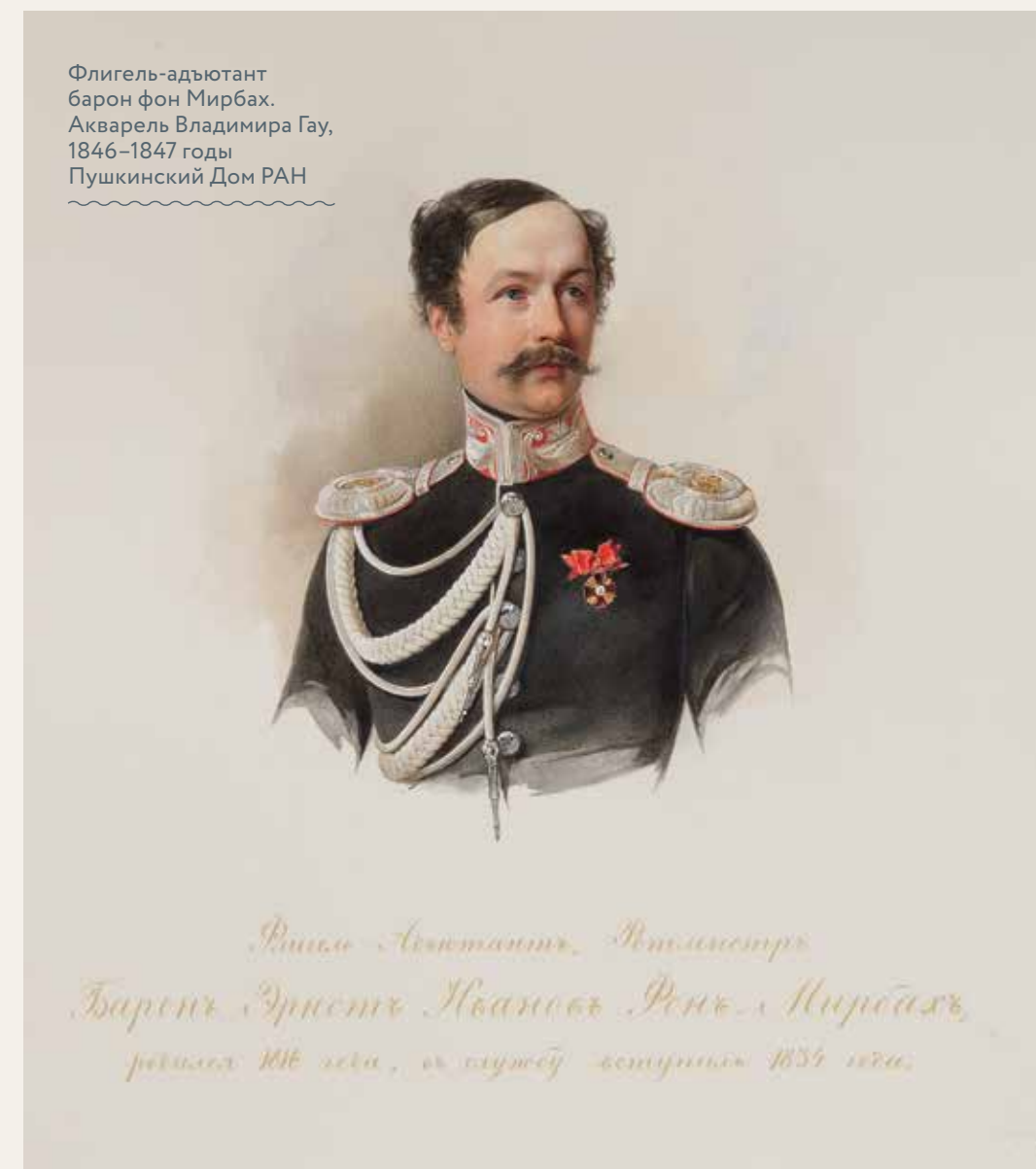
Флигель-адъютант барон фон Мирбах. Акварель Владимира Гау, 1846–1847 годы Пушкинский Дом РАН

Рядом с медалью мы не видим ни орденов Святого Георгия