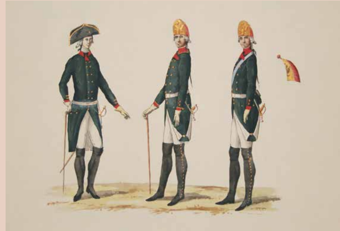
Форма 3-го морского батальона Черноморского флота: офицер, унтер-офицер фузилёрных рот, фузилёр и гренадерская шапка флигель-роты.

В мае эскадру Пустошкина отправили для блокады крепости Анкона. Севернее неё был высажен десант. В его рядах Чебышёв 1 июня отличился при захвате города Фано. 7 июня, возглавив штурм крепости