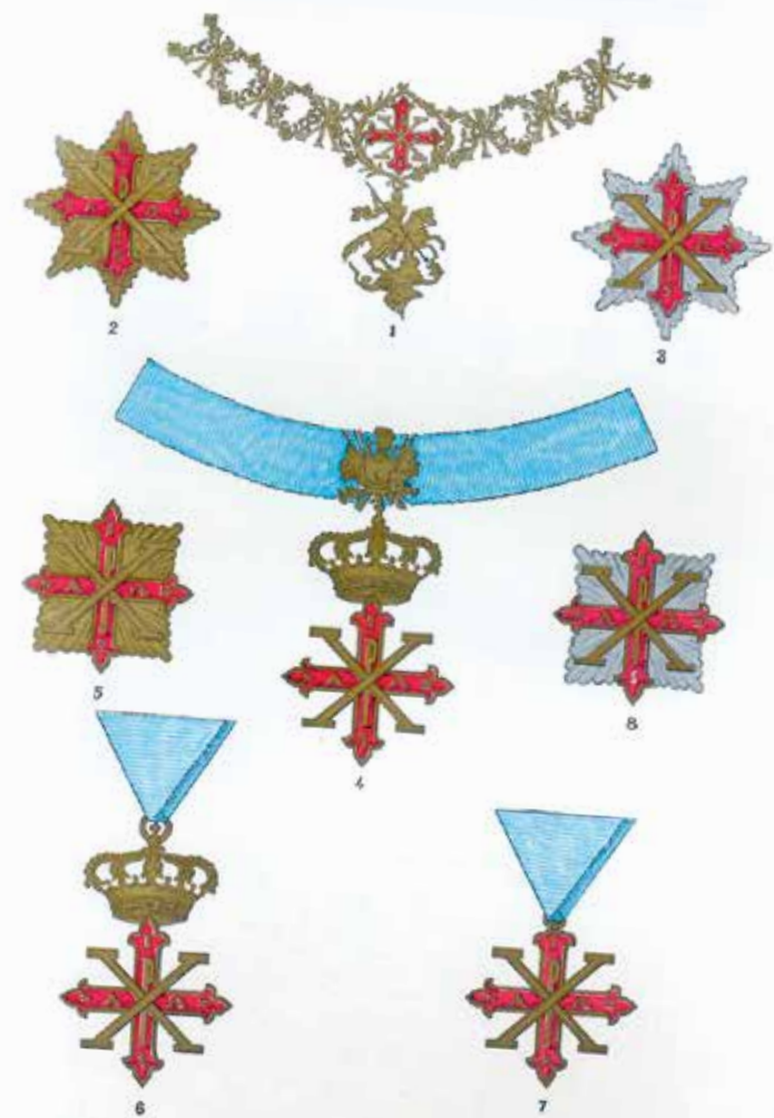
(1) Collare Costantiniano; (2) Placena dei Bafi, dei Cavalieri di Giustizia, dei Cavalieri di Gran Croce «Moto Proprio»; (3) Placena dei Cavalieri di Gran Croce, dei Cavalieri di Grazia, dei Cavalieri di Merito «Moto Proprio»; (4) Croce dei Cavalieri di Giustizia; (5) Placena dei Cavalieri Ecclesiastici; Categoria di Giustizia; (6) Croce dei Cavalieri di Grazia (da portarsi sospesa al collo); (7) Croce dei Cavalieri di Merito (sospesa al collo); (8) Placena dei Cavalieri Ecclesiastici (Categoria di grazia e di merito) e dei Cappellani.

Знаки Константиновского ордена Святого Георгия. Хромолитография. Неаполь, 1850-е годы По орденской иерархии Чебышёв относился к cavalieri di grazia