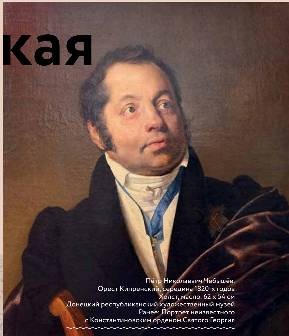
Пётр Николаевич Чебышёв. Орест Кипренский, середина 1820-х годов Холст, масло. 62 x 54 см Донецкий республиканский художественный музей Ранее: Портрет неизвестного с Константиновским орденом Святого Георгия

За последние годы мы, к сожалению, привыкли к тревожным новостям из Донецка. Между тем жизнь там не состоит лишь из военных сводок. 23 сентября отметил своё 80-летие Донецкий художественный музей, собрание которого насчитывает более 16 тысяч произведений живописи, графики, скульптуры, декоративно-прикладного искусства. Замечательным подарком к юбилею стала атрибуция портрета кисти Ореста Кипренского.