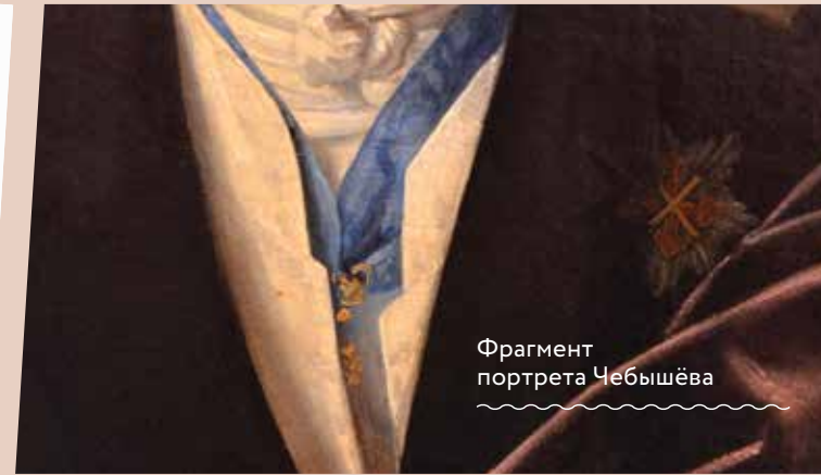
Фрагмент портрета Чебышёва

Поскольку орденские списки ничего не прояснили, я решил проверить рассказ о надписи на обороте портрета. Но в базе данных крупнейшего исследователя офицерского состава русской армии начала XIX века Сергея Львова подполковника