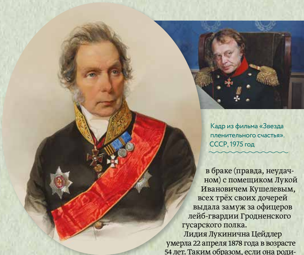
Кадр из фильма «Звезда пленительного счастья». СССР, 1975 год

Действительный статский советник Иван Богданович Цейдлер. Акварель Владимира Гау. 1846–1847 годы Пушкинский Дом РАН