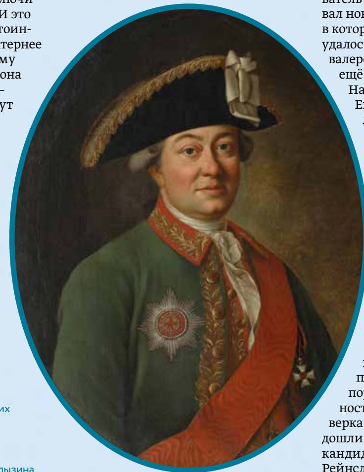
Генерал-майор Пётр Талызин. 1781–1782 годы Музей В. А. Тропинина и московских художников его времени Атрибуция Александра Вальковича в 2007 году Ранее: портрет адмирала Ивана Талызина