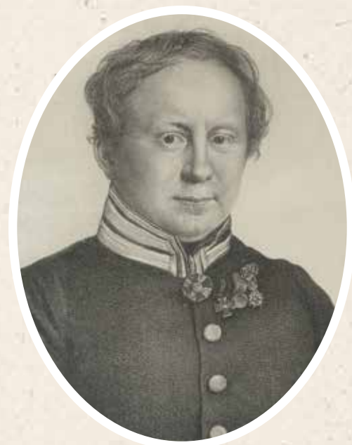
Доктор Николай Фёдорович Арендт. Литография Отто (Ермолая Ивановича) Эстеррейха, 1822 год. Государственный музей А. С. Пушкина

Документы о награждении Н. Ф. Арендта офицерским крестом ордена Почётного легиона 4 марта 1819 года. Национальный архив Франции. В документах указано, что на самом деле Арендт родился не в Казани 4 мая 1786 года, а в Москве 4 декабря 1785 года.