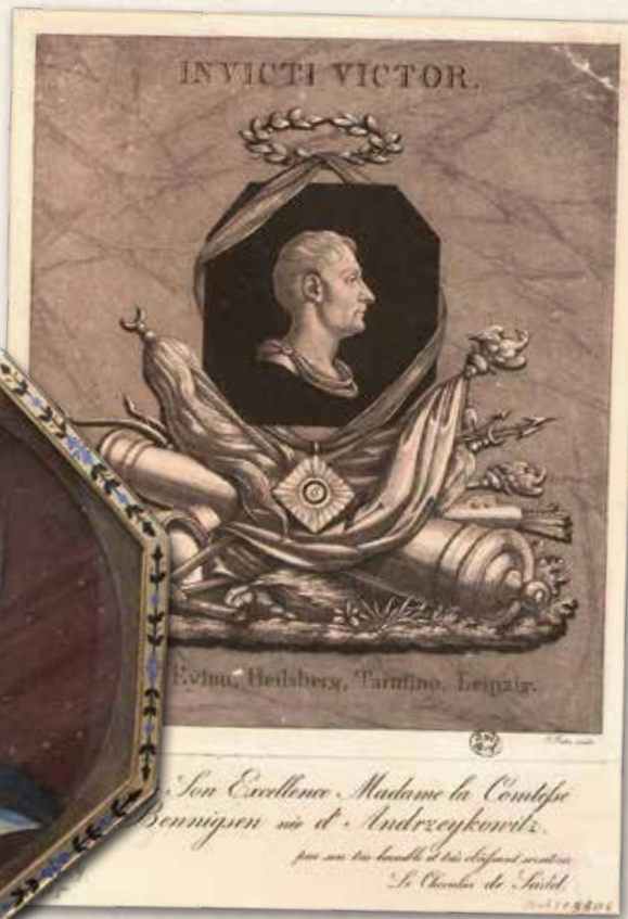
Генерал граф Леонтий Леонтьевич Беннигсен. 1818 год Гравюра Фабера по миниатюре Генриха Зейделя Государственный Эрмитаж

одним из лучших в его творчестве. Работая над поэмой «Медный всадник», Пушкин в 1833 году переписал польские стихи Мицкевича и даже собирался сделать их русский перевод.