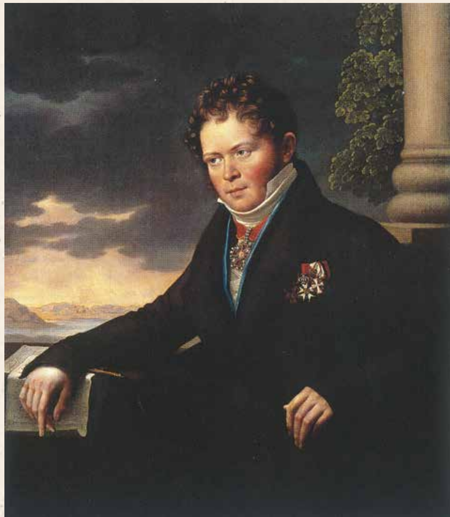
Коллежский советник Андрей Егорович (Генрих) Зейдель. Портрет кисти Юзефа (Иосифа) Олешкевича, 1822 год. Холст, масло. 115,5 x 93 см. Государственная Третьяковская галерея. Ранее: портрет хирурга Н. Ф. Арендта.

В связи с временным закрытием музеев для борьбы с пандемией особую активность приобрели их деятельность в онлайн-формате. Аудитории были предложены тысячи экскурсий, выставок, лекций, мастер-классов. Автор этих строк тоже не остался в стороне и вместе с «Дилетантом» запустил свой канал на YouTube с видеорассказами о наиболее интересных атрибуциях. Ведь даже в этот «закрытый» период изучение музейных коллекций не останавливалось. Так, в апреле с помощью коллег из разных стран мне удалось решить загадку, интересовавшую меня более тридцати лет и уходящую своими корнями в XIX столетие.