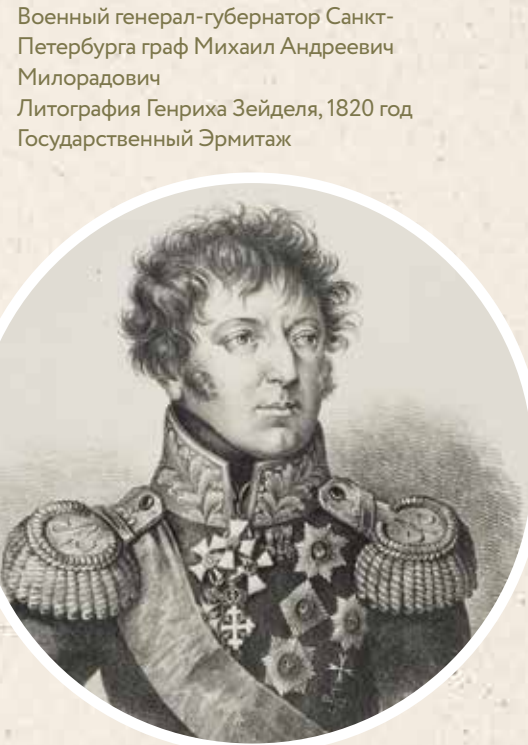
Военный генерал-губернатор Санкт-Петербурга граф Михаил Андреевич Милорадович Литография Генриха Зейделя, 1820 год Государственный Эрмитаж

иностраннных, носил орден Святой Анны 2-й степени с алмазами и орден Святого Владимира 4-го класса. Нет никаких сомнений, что именно он, а не Арендт изображён на портрете. ▽