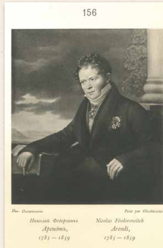
Публикация портрета в издании великого князя Николая Михайловича «Русские портреты XVIII и XIX столетий» 1908 года