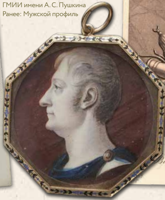
Генерал граф Леонтий Леонтьевич Беннигсен. 1818 год Миниатюра Генриха Зейделя ГМИИ имени А. С. Пушкина Ранее: Мужской профиль