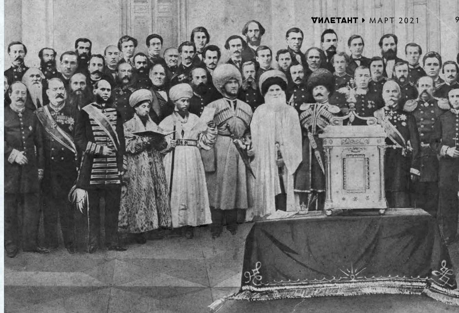
▲ Имам Шамиль с двумя сыновьями в окружении представителей властей и калужского дворянства после принятия присяги на верноподданство Александру II. Парадный зал Дворянского собрания Калужской губернии. 26 августа 1866 года. Фотоколлаж Бернарда Гольдберга. Фрагмент. Калужский объединённый музей-заповедник. Второй слева с орденой лентой через плечо — губернский предводитель дворянства Фёдор Сергеевич Щукин, который после присяги произнёс в адрес Шамиля официальные поздравления и приветствие

Время службы Щукина выпало на подготовку и проведение отмены крепостного права. В 1858–1859 годах