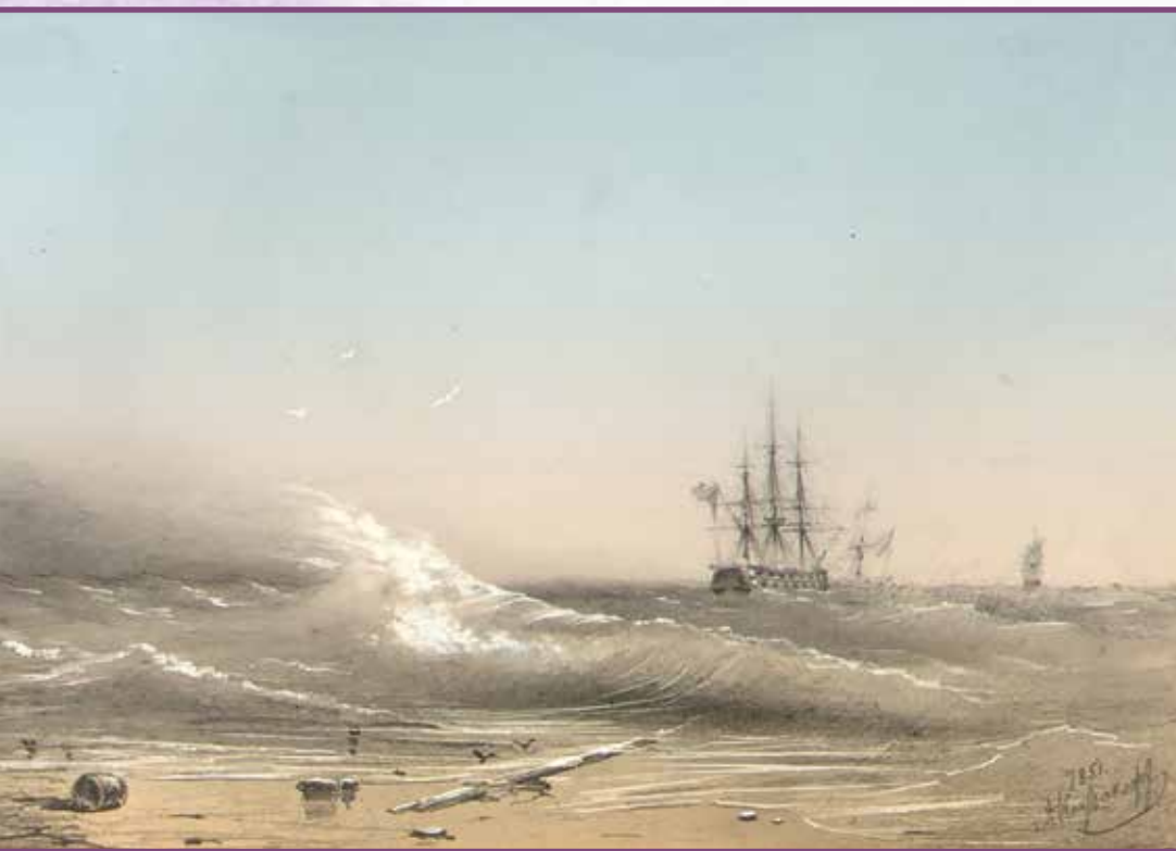
▲ Морской пейзаж. Александр Корсаков, 1851 год Государственная Третьяковская галерея

Благодаря морской службе, Корсаков в 1848 году действительно находился в Константинополе. Затем он вернулся в Крым и летом 1849 года перевозил войска и грузы по Чёрному морю. 8 августа 1850 года Корсаков вышел в отставку и после смерти матери занимался делами наследства в Псковской губернии. Таким образом, он мог нарисовать с натуры все те пейзажи, которые подписаны «Саша Бака».