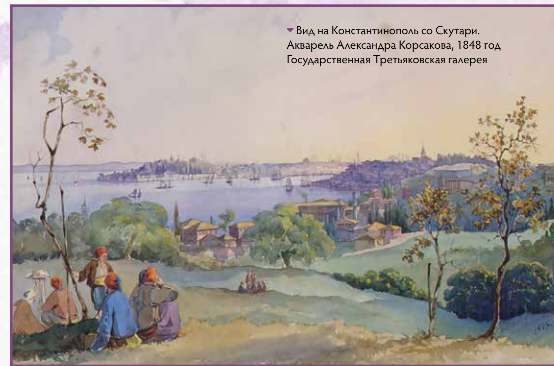
► Вид на Константинополь со Скутари. Акварель Александра Корсакова, 1848 год. Государственная Третьяковская галерея

адъютанта, чтобы он уже состоял при влиятельном начальнике до нужной выслуги, а затем утверждали его в должности официально. По всей видимости, перед нами именно такой редкий случай.