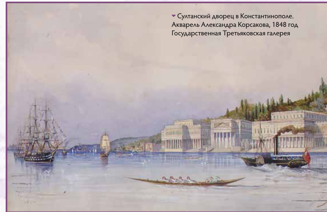
► Султанский дворец в Константинополе. Акварель Александра Корсакова, 1848 год. Государственная Третьяковская галерея

Однако среди морских офицеров того времени не было никого с фамилией Бака. Судя по одной звёздочке на эполетах, перед нами мичман или прапорщик. Это довольно странно, поскольку адъютантами на флоте назначали только тех, кто уже отслужил офицером три года и совершил три шестимесечные морские кампании (плаванья). В результате адъютантами становились минимум лейтенанты и поручики. Правда, для протекции юным аристократам имелась лазейка. Новоиспечённого мичмана могли назначить не адъютантом, а исполняющим обязанности