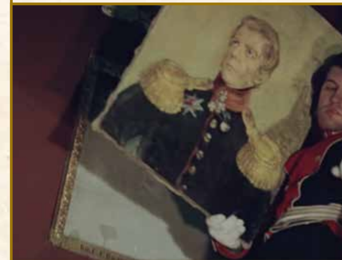
▶ Кадр из фильма «Звезда пленительного счастья». СССР, 1975 год

Поскольку Военная галерея открылась через год после восстания декабристов, то показанное в известном фильме «Звезда пленительного счастья» изъятие из нее портрета князя Волконского является лишь популярным киновымыслом — ни галереи, ни тем более портрета декабриста в ней тогда просто не было.