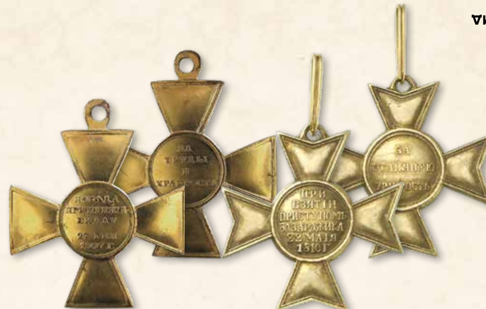
▲ Золотые кресты для офицеров — участников битвы при Прейсиш-Эйлау и штурма Базарджика

После Тильзита Александр I надеялся поднять престиж за счёт успехов в Русско-турецкой войне. Но шла она не очень удачно. Русские войска неизменно били турок, но болезни