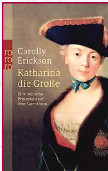
▲ Екатерина Великая. На обложке вместо императрицы изображена княгиня Дашкова. Немецкое издание 2004 года

Тщеславный Сальдерн окружил себя показной роскошью и обставил дом мемориальными вещами,