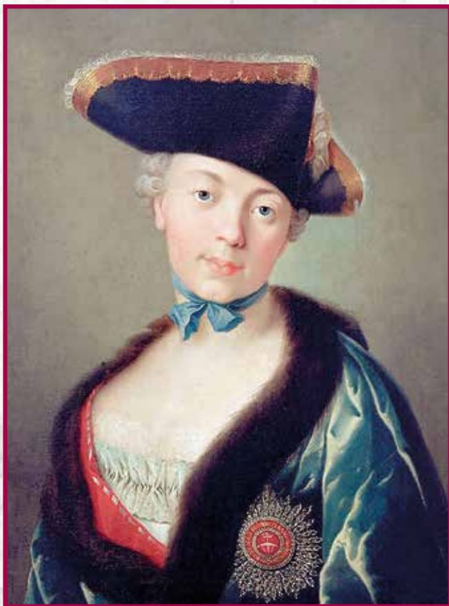
▲ Княгиня Екатерина Романовна Дашкова. Вариант портрета Пьетро Ротари 1762 года Ширензее. Ранее: портрет молодой Екатерины II