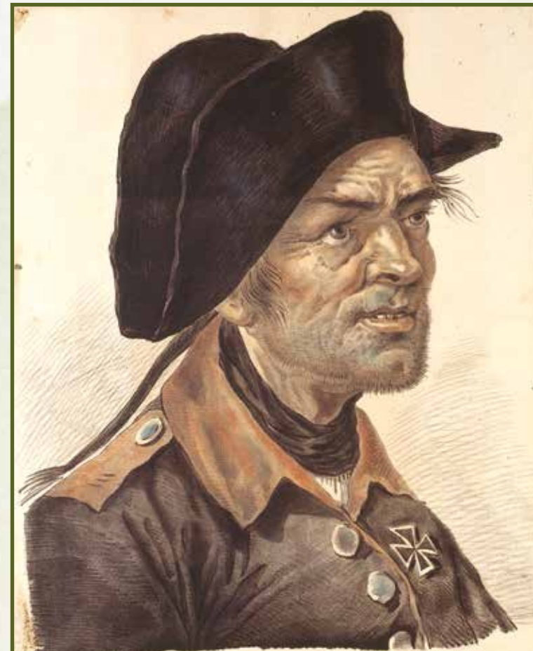
◀ Раскрашенная литография Александра Орловского, неверно считающаяся портретом Брызгалова. Около 1823 года. ГМП

писал известный мемуарист Филипп Вигель, «последние памятники того несчастного царствования — укрепления Михайловского замка