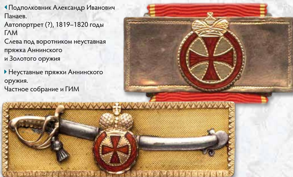
▶ Неуставные пряжки Аннинского оружия. Частное собрание и ГИМ

Среди военных портретов довольно редко встречаются изображения в полный рост. Тем замечательнее акварель из собрания Государственного музея истории российской литературы имени Владимира Даля (ГЛМ), на которой изображён гусарский офицер во всём великолепии своей парадной формы, да ещё и на фоне коня с расшитым вальтрапом*. Многочисленные и тщательно выписанные неизвестным художником детали позволяют точно установить, что офицер служил в Иркутском гусарском полку в 1817–1820 годах.