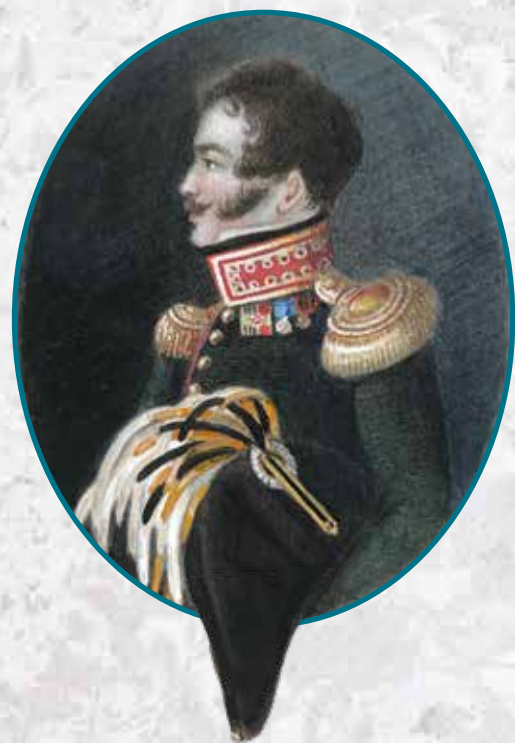
▶ Подполковник Александр Иванович Панаев. Автопортрет (?), 1819–1820 годы ГЛМ Слева под воротником неуставная пряжка Аннинского и Золотого оружия