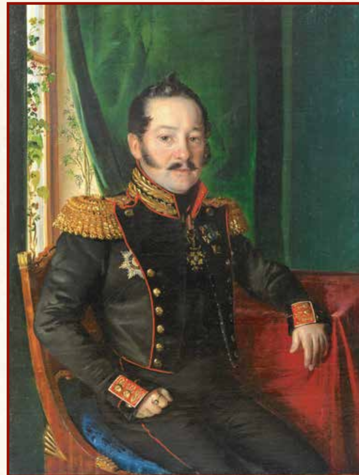
▲ Григорий Фёдорович Козлянинов. Роберт Шведе (?), 1840–1842 годы Государственный исторический музей Ранее: портрет неизвестного офицера за столом

заявленное на обороте копии авторство художника Егора Ботмана 1843 года. Манера исполнения портрета сильно отличается от образцов его творчества. Да и по датировке есть противоречие. На левом эпюлете генерала просматриваются только две звёздочки. Между тем ещё 1 октября 1842 года Козлянинов был произведён в генерал-лейтенанты и с этого времени носил уже три звёздочки на эпюлетах.