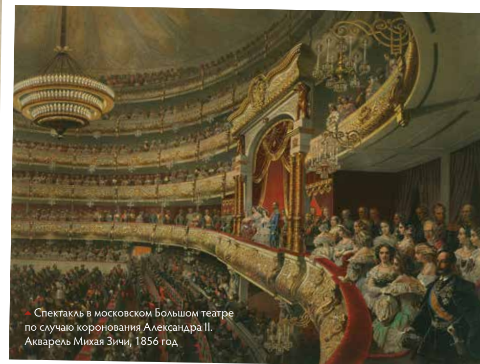
▶ Спектакль в московском Большом театре по случаю коронации Александра II. Акварель Михаила Зичи, 1856 год