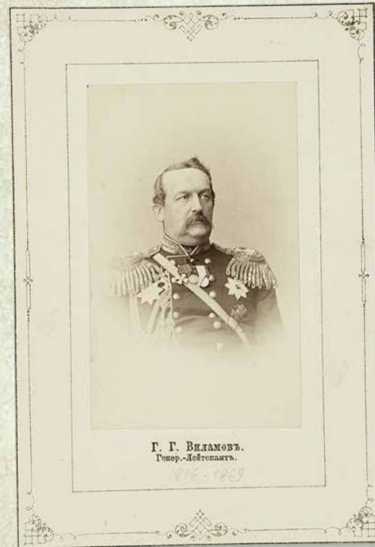
Г. Г. Вилламовъ. Генер.-Лейтенантъ.